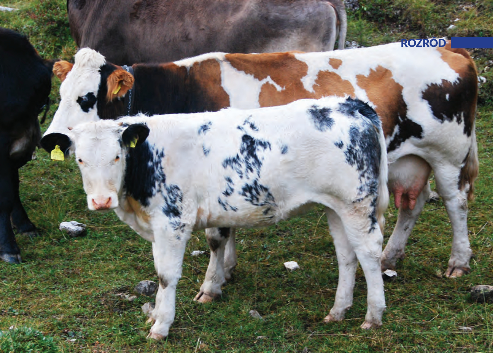
Dojrzałość hodowlana jałówki jest zależna od osiągniętej masy ciała

hodowlanej określanej przede wszystkim przez masę ciała. Pośpiech w tej kwestii grozi bowiem trudnościami porodowymi wynikającymi z płodów względnie za dużych. Jedną z alternatyw jest cielenie się jałówek w wieku 3 lat, ale niewielu hodowców bydląt – szczególnie ras szybko dojrzewających – może sobie pozwolić na ten luksus. Wykazywano niejednokrotnie, że jałówki rodzące po raz pierwszy w wieku 2 lat dają więcej cieląt w ciągu życia, z wyższą średnią wagą przy odsadzeniu niż te, u których pierwsze wycielenie miało miejsce w wieku 3 lat. Do tego doliczyć trzeba wysokie miesięczne koszty utrzymania „nieproduktywnych” jałówek. Z drugiej jednak strony u ras późno dojrzewających, jak Charolaise czy Simmental, czekanie z dopuszczeniem do rozrodu i planowanie pierwszego wycielenia w wieku 3 lat jest bardziej uzasadnione.