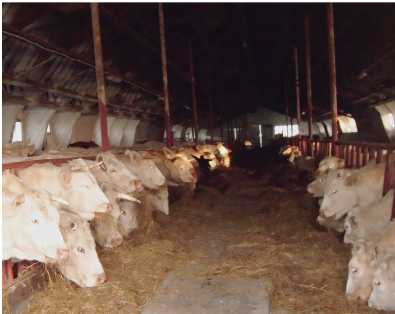
Fot. 9. Przejazdowy korytarz paszowy umożliwiający dowóz paszy objętościowej ciągnikiem z wozem paszowym – zmechanizowanie tych prac konieczne przy większej liczbie zwierząt