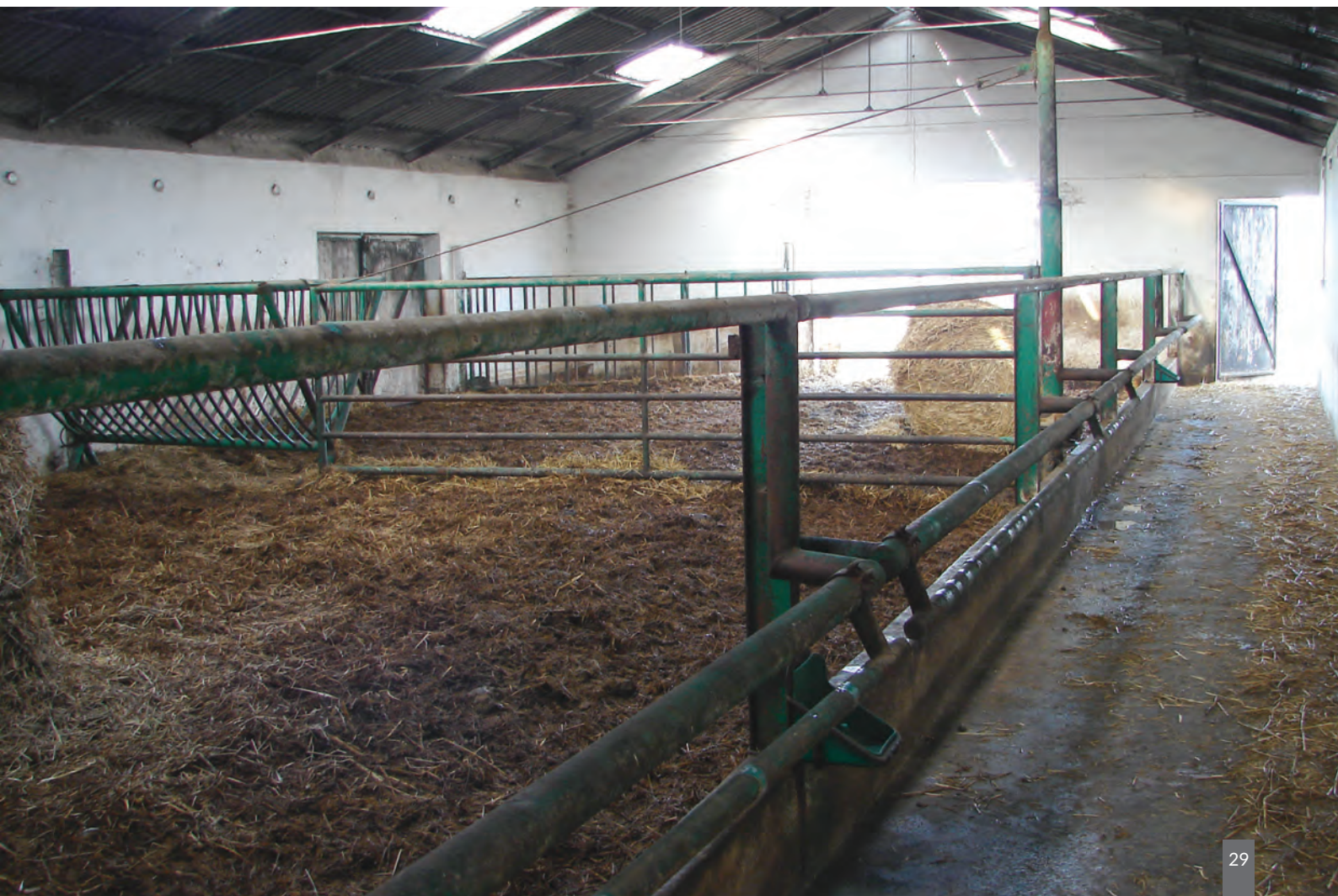
Fot. 6. Mogą być oczywiście specjalnie wybudowane, nowoczesne budynki dla chowu bydła mięsnego, o dużej kubaturze, podzielone na kojce z wyjściami na wybiegi, z korytarzem paszowo-spacerowym (kontrolnym) czy świetlikami w połaci dachowej