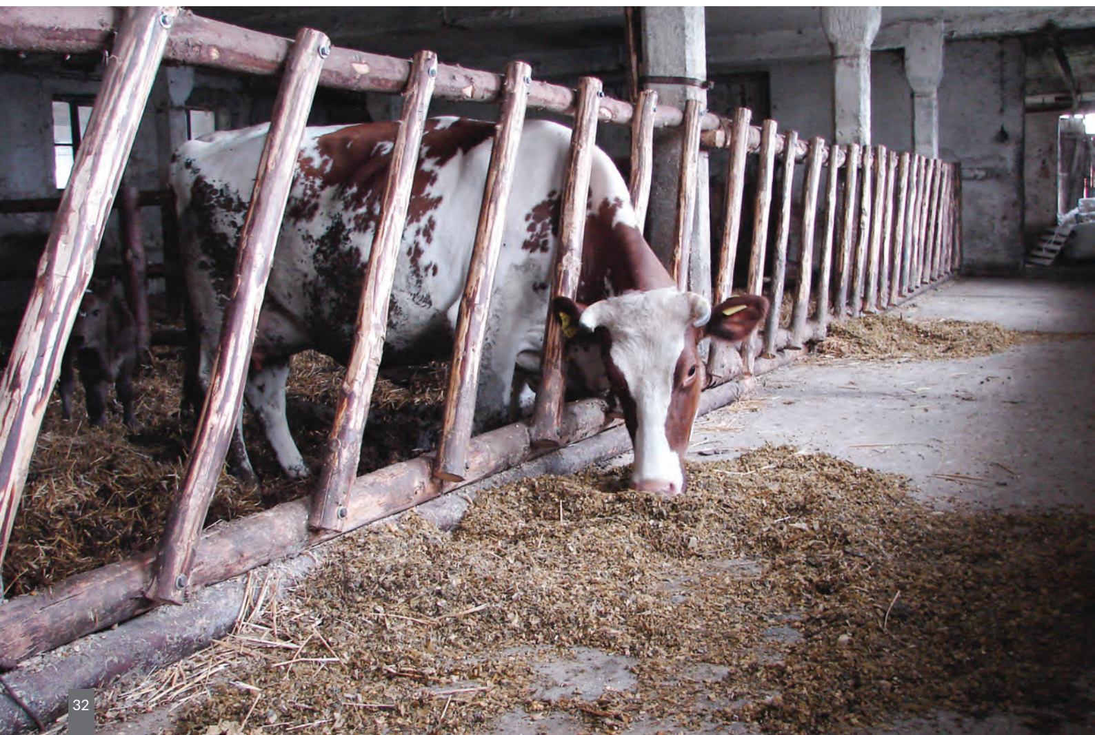
Fot. 8. Przegrody ukośne ograniczają rozrzucanie paszy objętościowej na ganku paszowym