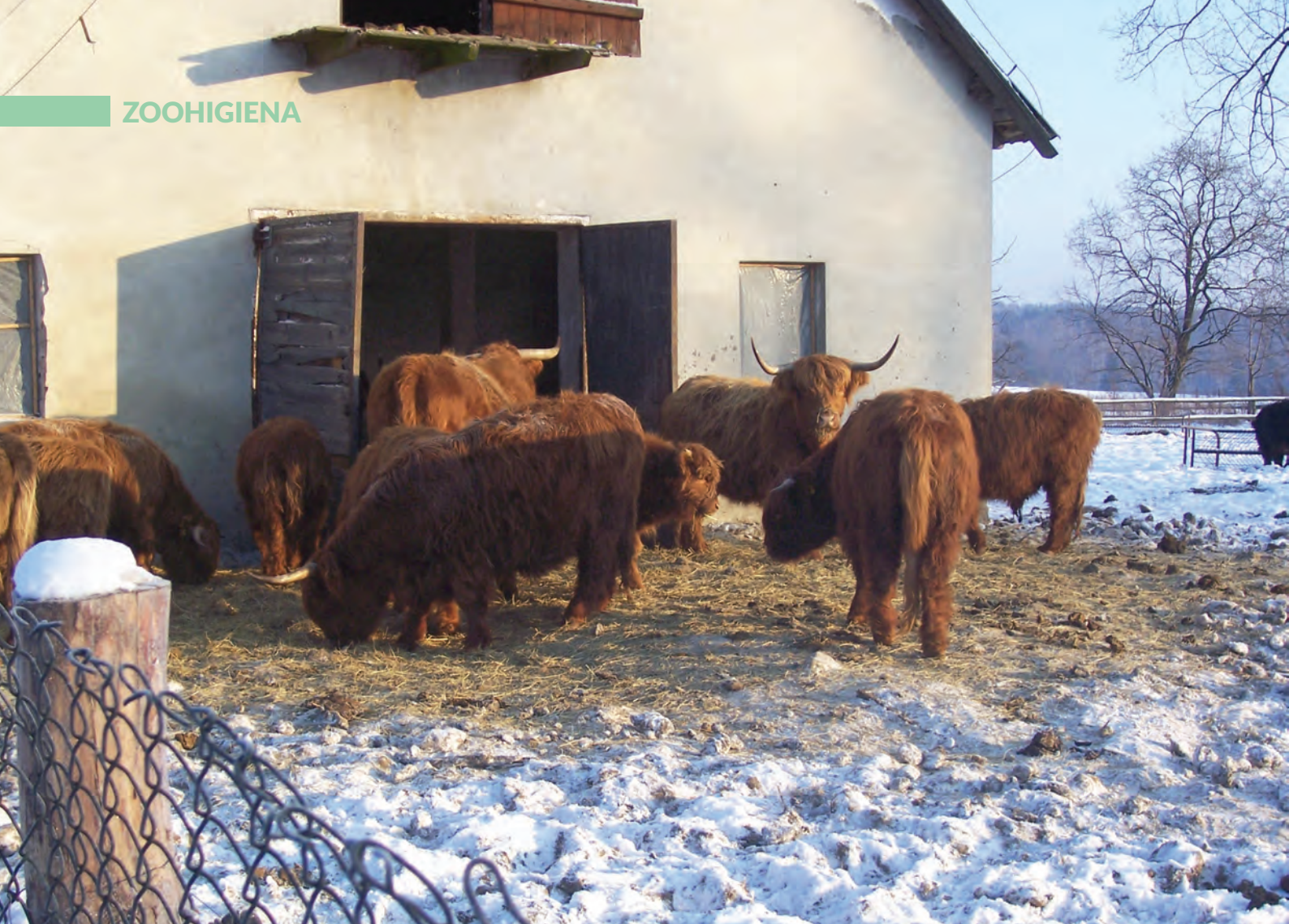
Fot. 1. Bydło mięsne, które ma możliwość korzystania z budynków, chętniej i częściej jednak przebywa pod gołym niebem, nawet przy bardzo niskich temperaturach