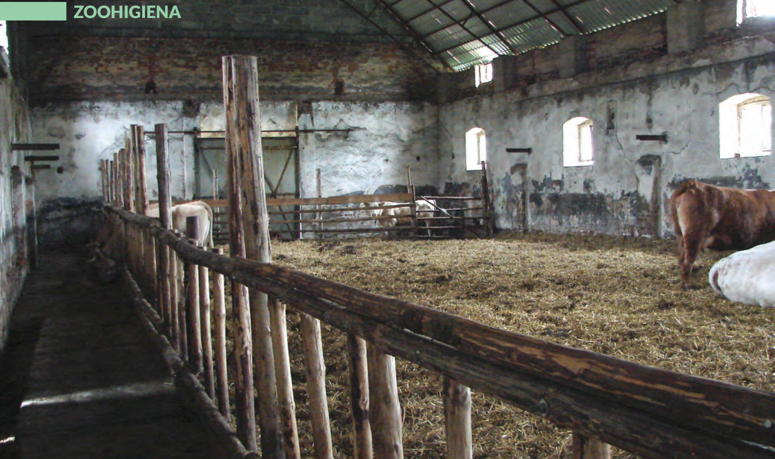
Fot. 7. W starej stodole też można z powodzeniem przy pomocy drewnianych żerdzi wydzielić korytarz paszowo-spacerowy i wydzielić różnej wielkości kojce dla poszczególnych grup technologicznych