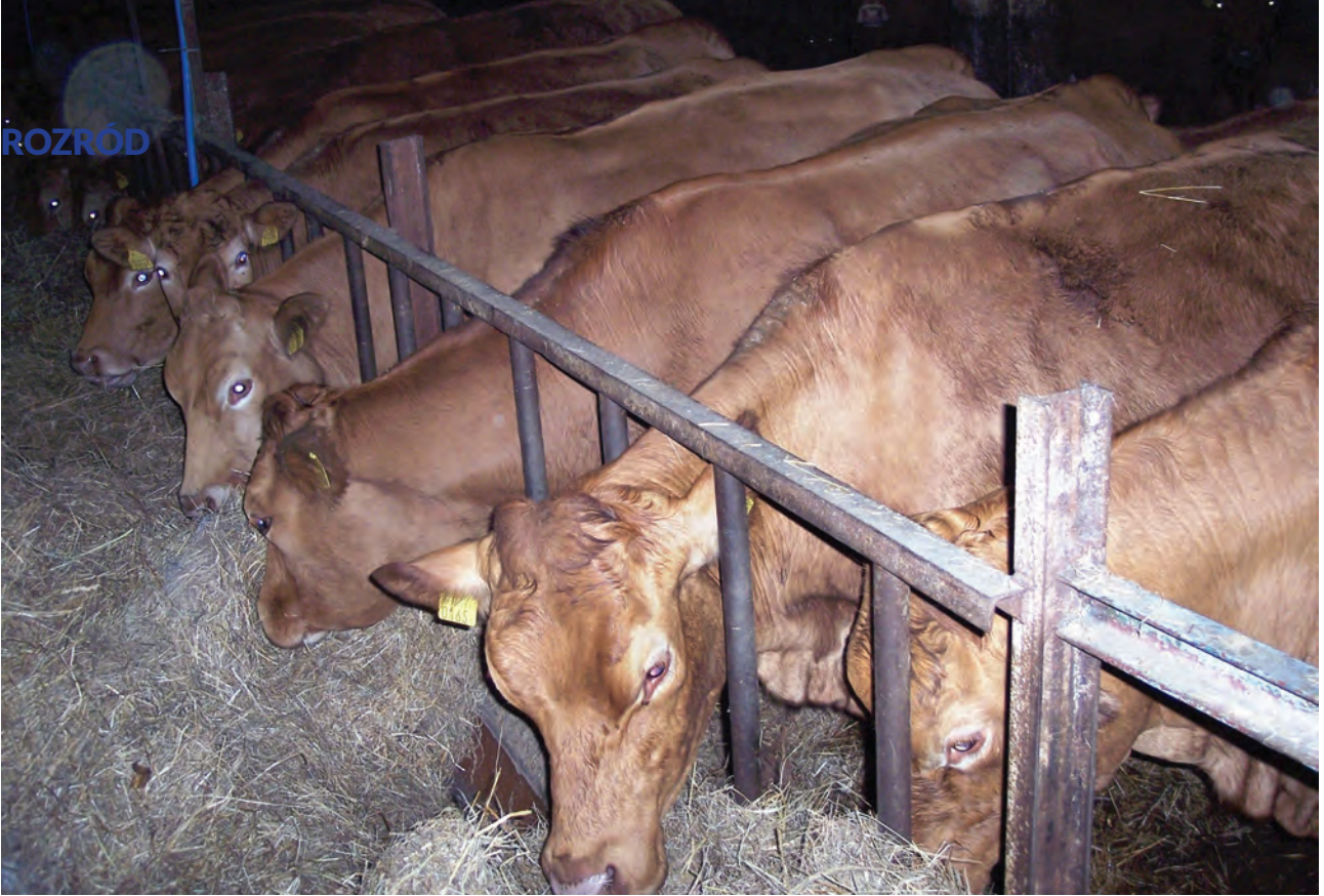
Wygląd zewnętrzny nie powinien być jedynym czynnikiem decydującym o przeznaczeniu jałówek na remont stada

właściciele stada oraz ich doradcy (żywieniowci, lekarze wet.), brzmi: jaki średni dzienny przyrost masy ciała na poziomie grupy jałówek jest potrzebny (czyli mówiąc wprost: jak karmić?), aby mieć wystarczającą liczbę jałówek zdolnych do zajścia w ciążę w okresie (sezonie) rozrodczym? Należy więc odpowiednio zaplanować dawki żywieniowe, aby osiągnąć pożądaną dzienną przyrost.