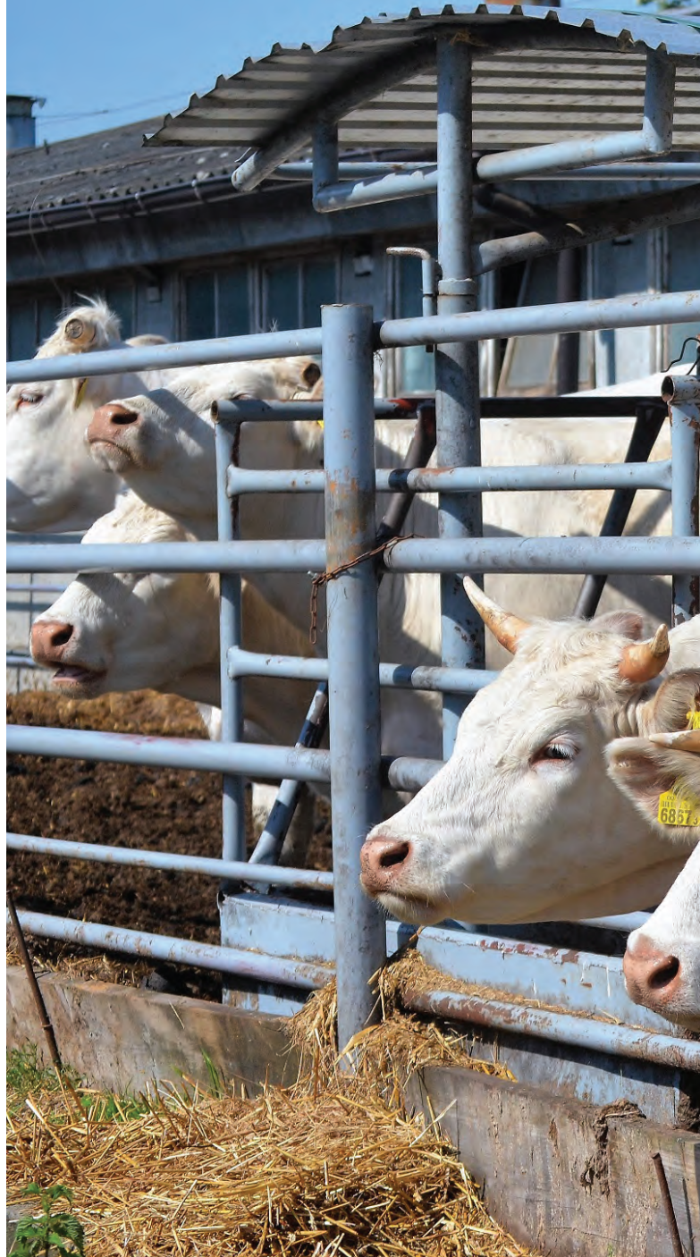
Tabela 1. Wyniki odchowu cieląt ras mięsnych w okresie żywienia pastwiskowego oraz charakterystyka krów matek [Strzetelski i wsp., 2000]

W początkowym okresie, a więc na początku sezonu pastwiskowego, w odroście o wysokości ok. 15 cm, występuje nadmiar białka przy niskiej zawartości suchej masy oraz zawartego w niej włókna i innych składników energetycznych; koncentracja energii zwiększa się znacznie przy intensywnym nawożeniu pastwiska azotem. W okresie późniejszym, przy odroście o wysokości