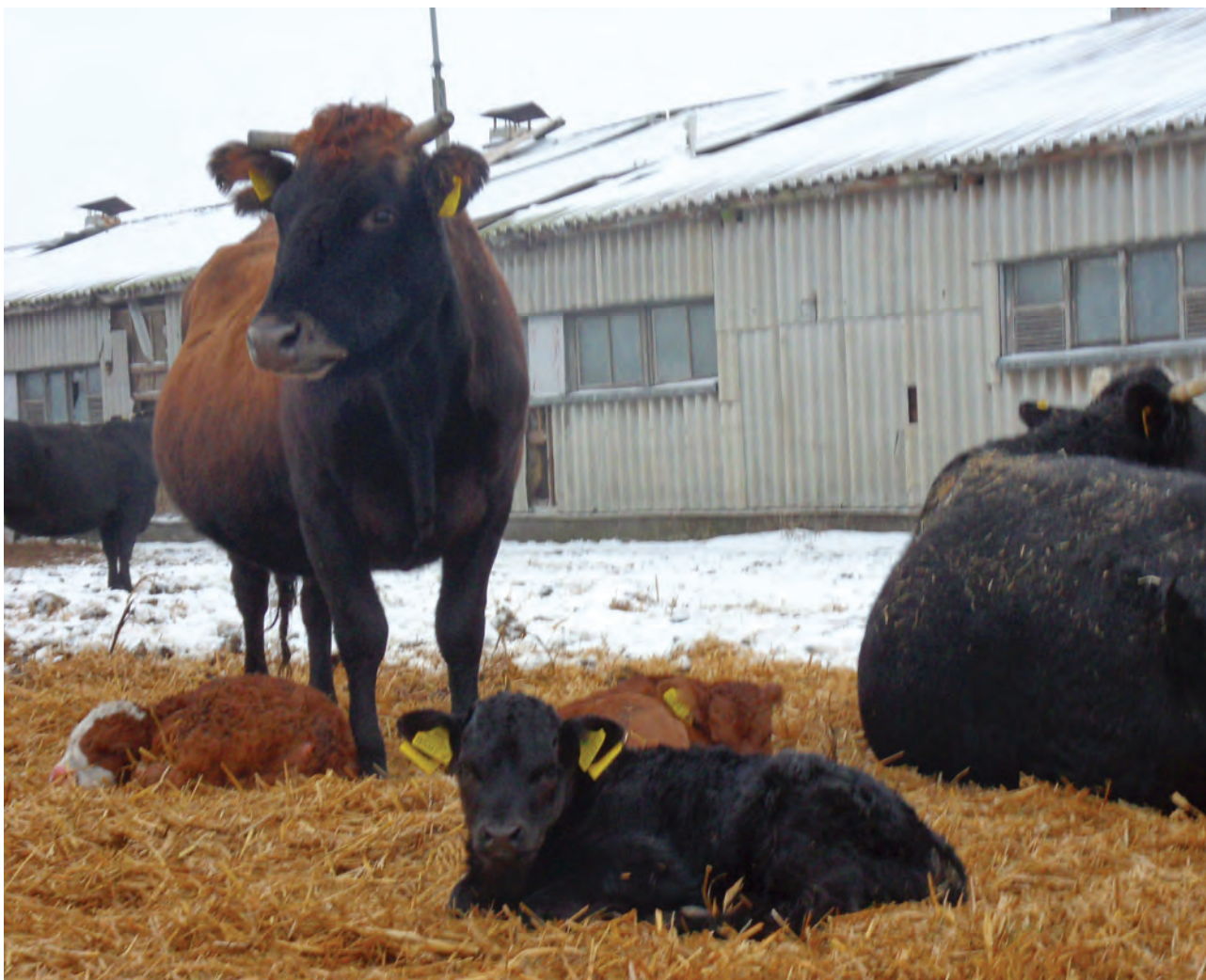
Fot. 4. Urodzone zimą cielęta także wybierają świeże powietrze niż budynek – warto o tym pamiętać i zadbać o wyścielenie suchą słomą fragmentu wybiegu

wytwarzania. Próba oddziaływania wyodrębnionego na którykolwiek z czynników wejściowych bez dostosowania budynku obory prowadzi do niepowodzenia gospodarczego.