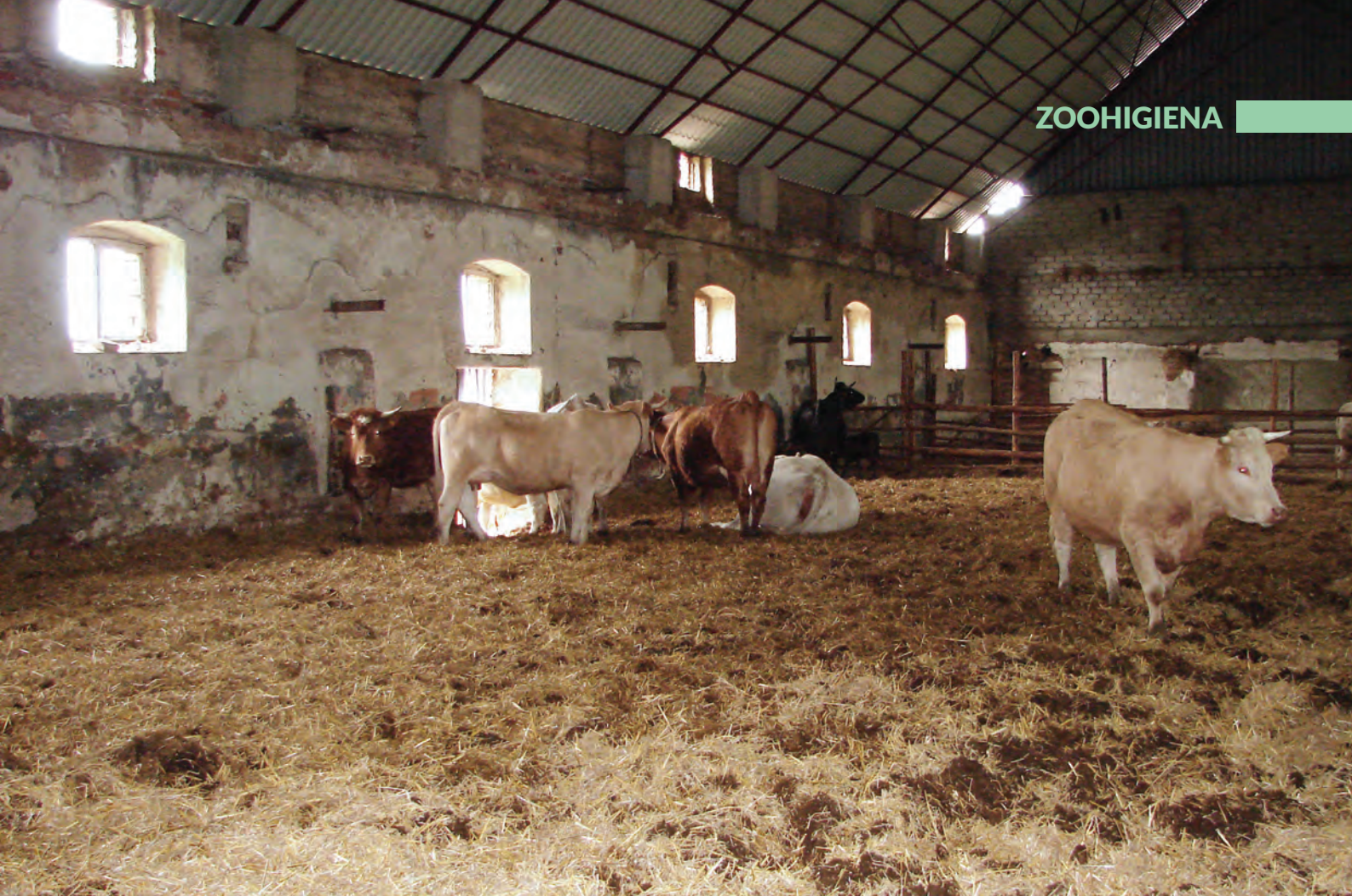
Fot. 5. Dla bydła mięsnego znakomicie nadają się nie tylko klasyczne obory, ale inne budynki, np. opuszczone stodoły